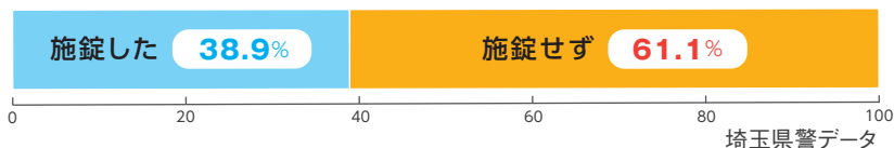
被害時の施錠の有無(令和3年被害件数8,563件)

さらに、この条例では、自転車利用者の責務の一つに「盗難防止のための施錠等の防犯対策」を掲げています。 令和4年の自転車盗難の認知件数は11月末時点で既に9,000台を超えています。盗難被害にあった自転車のうち、約6割がカギをかけていませんでした。